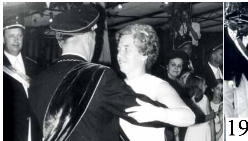
1969 errang Anton Strake die Königswürde. Zu seiner Mitre also in diesem Jahr zu den Jubelpaaren, es regierte in dem

schätzung. Zweifellos sei die Zuordnung Oestinghausens zur Großgemeinde Bad Sassendorf nicht im gleichen Maße geboten wie die von Bettinghausen. „Werden im Raum Herzfeld andere Möglichkeiten verwirklicht, würde eine Einbeziehung von Eickelborn und Lohe zur Gemeinde Herzfeld auch die Zuordnung der Gemeinde Oestinghausen nahelegen. „Die bessere Lösung ist es jedoch, beide Gemeinden Bad Sassendorf anzuschließen“ wird an die Gemeinsamkeiten erinnert. So flößen die Abwässer aus Bettinghausen zur Kläranlage nach Oestinghausen, auch könnte versucht werden, für beide Gemeinden die Grundschule zu halten, „was für Bettinghausen allein nicht möglich ist“. „Während Sassendorf mit Bettinghausen erst 7.270 Einwohner hätte, würden sich unter Einschluss von Oestinghausen 7.909 Einwohner ergeben, die den Ausbau einer befriedi-