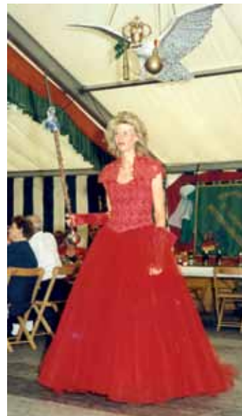
Wer ist dieser Spielmann des Jahres 1994?